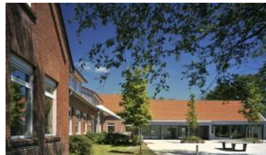
Standort Elisabeth- fehn